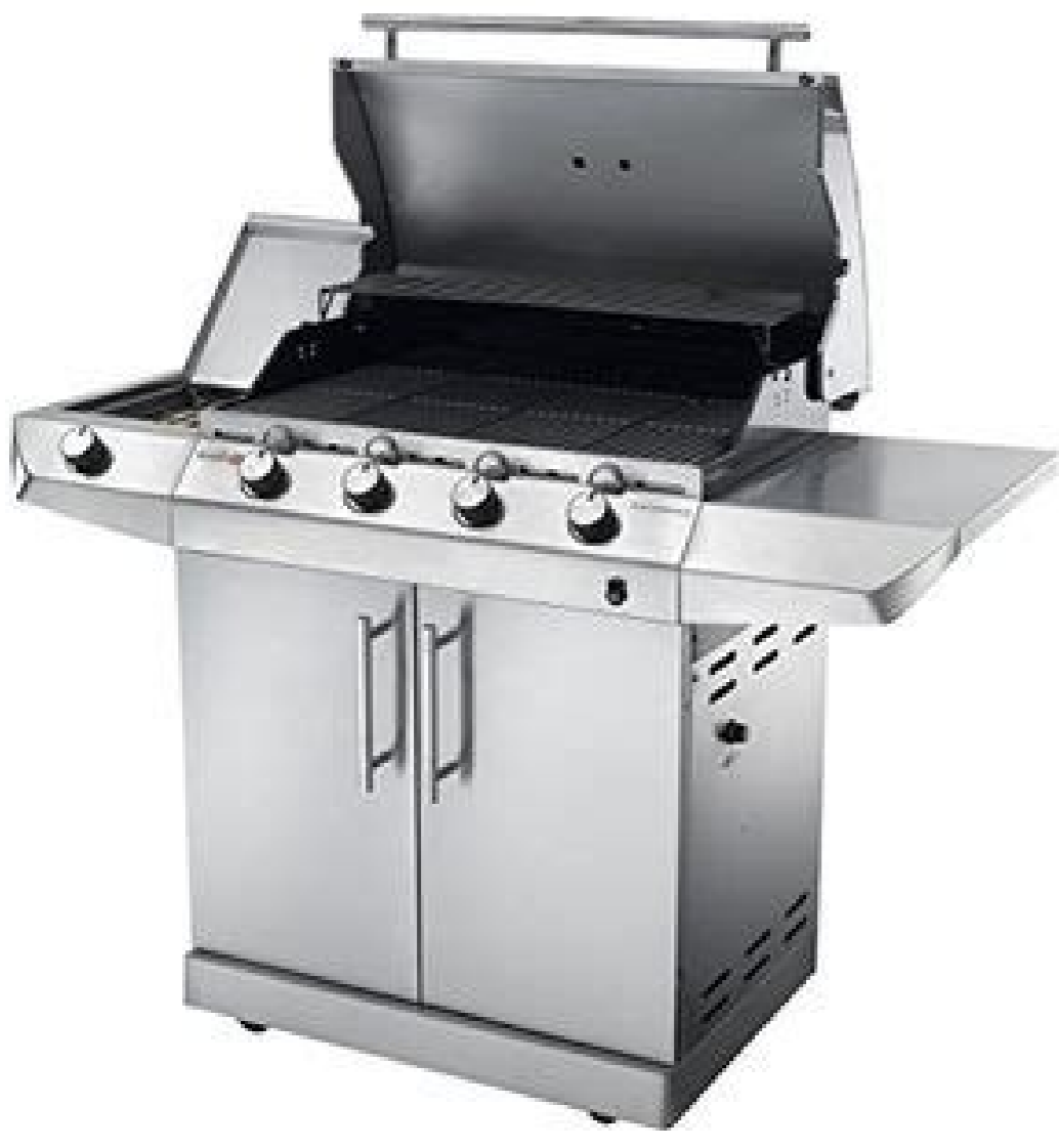
Char-broil performance series t47g test.